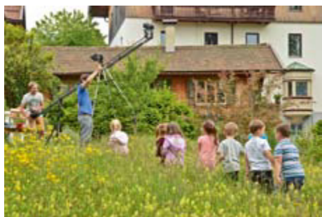
Voller Begeisterung toben die Kinder in ihrem Natur-Erlebnis-Kindergarten Tegernsee für unsere Filmaufnahmen ...