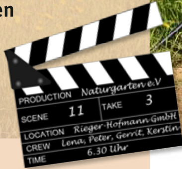
Mit ruhiger Hand: „Kranarbeiten“ auf den Wildblumenfeldern der Rieger-Hofmann GmbH

W as anfangs nur ein unglaublicher Wunschtraum war, wurde nach und nach Realität. Peter Locher und Helene Gunin (Lena) wohnen erst seit Juni 2013 im gleichen Haus und gingen tagein, tagaus mit ihren Kameras an mir